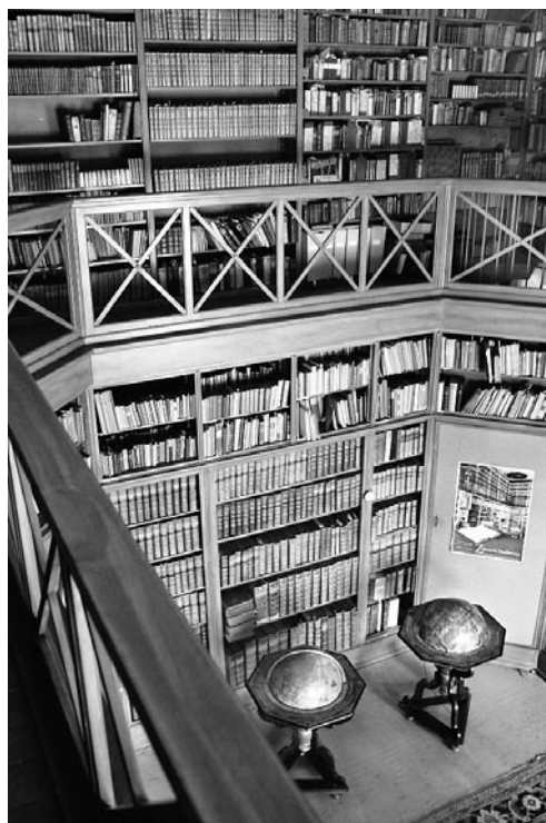
Obrázek č. 3: Mobiliář zámecké knihovny v Teplicích přemístěný do prostoru bývalého divadla na zámku, dnes knihovna muzea.