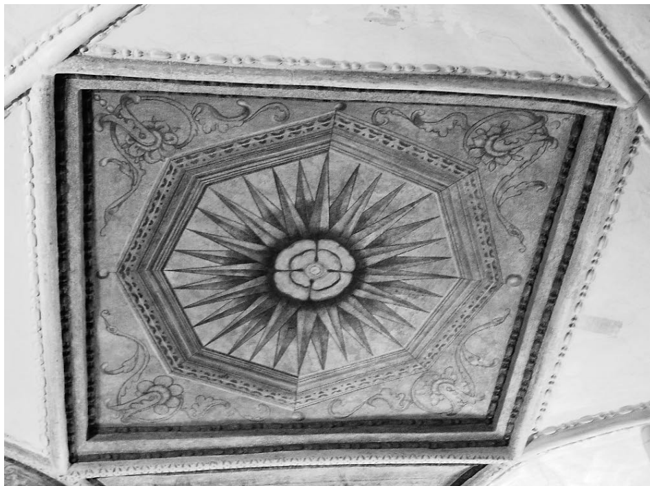
Obrázek č. 1: Motiv renesanční výzdoby stropu knihovny (1600) v zámecké věži připomíná poslední české majitele z rodu Vchynských (Kinský). Po roce 1700 zde byla zřízena barokní knihovna. (Restaurováno 2015 Mgr. Art. Kateřinou Prokopovou).