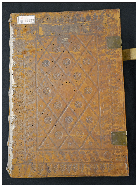
Obrázek č. 3: Příklad užití kolků ze skupiny Gotische Dachbegrönung frei I (VKOL, sign. III 47.723).