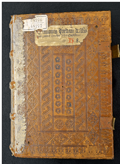
Obrázek č. 2: Příklad užití kolků ze skupiny Gotische Dachbegrönung frei I (VKOL, sign. II 48.276-II 48.277).