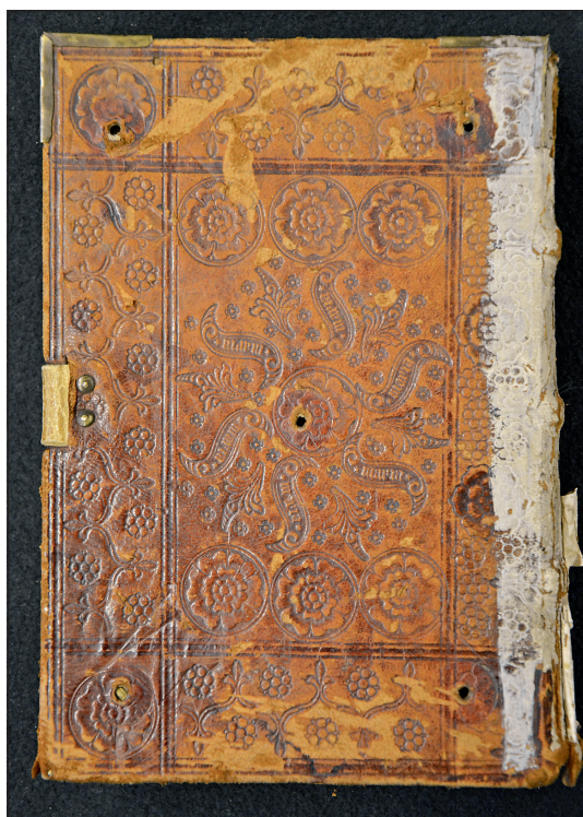
Obrázek č. 7: Příklad užití kolků skupiny Olmütz Kartäuserkloster (VKOL, sign. II 48.320).