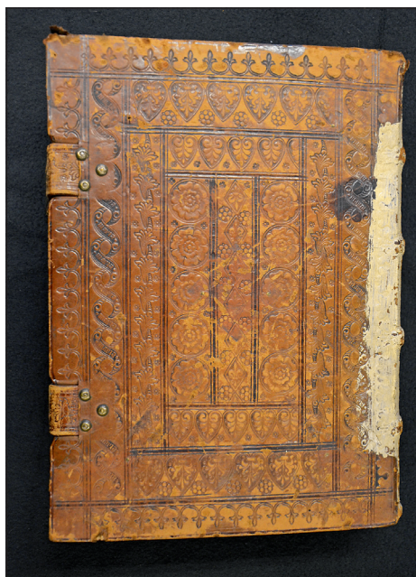
Obrázek č. 6: Příklad užití kolků skupiny Olmütz Kartäuserkloster (VKOL, sign. 60.927-60.930).