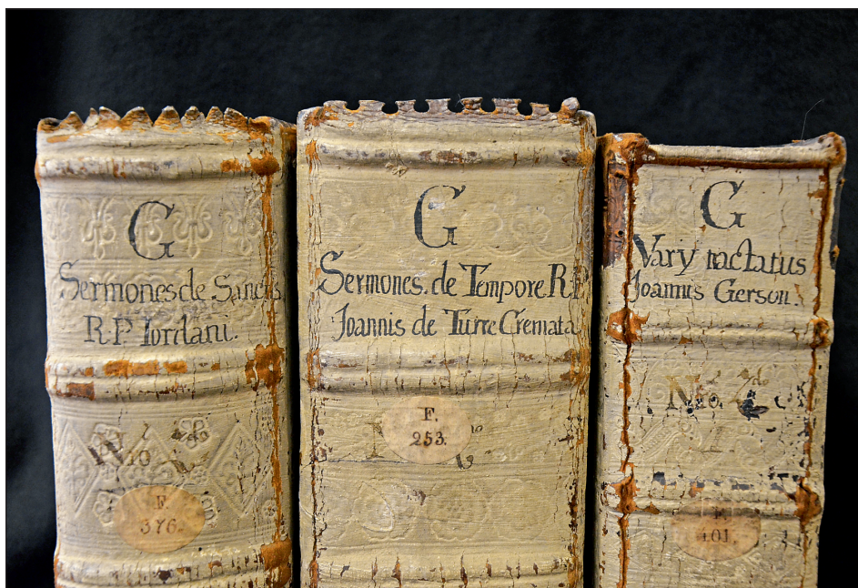
Obrázek č. 8: Typická sekundární úprava hřbetů s příklady původního ozdobného vykrojení.