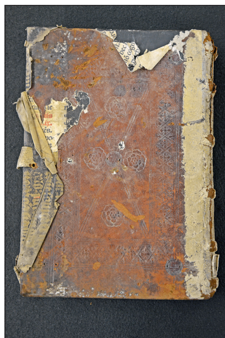
Obrázek č. 10: Zbytky po typické barokní úpravě vazeb u knih olomouckých kartuziánů (VKOL, sign. M II 246).