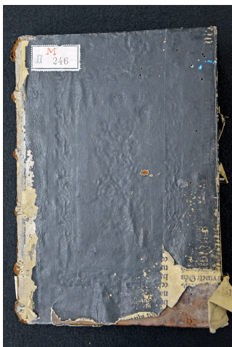
Obrázek č. 9: Sekundárně přelepená a začerněná vazba z dílny olomouckých kartuziánů (VKOL, sign. M II 246).