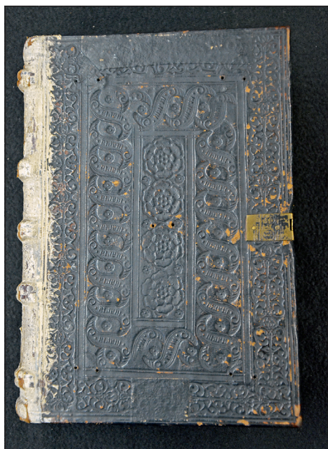
Obrázek č. 5: Sekundárně začerněná vazba s kolký skupiny Olmütz Kartäuserkloster (VKOL, sign. M I 279).