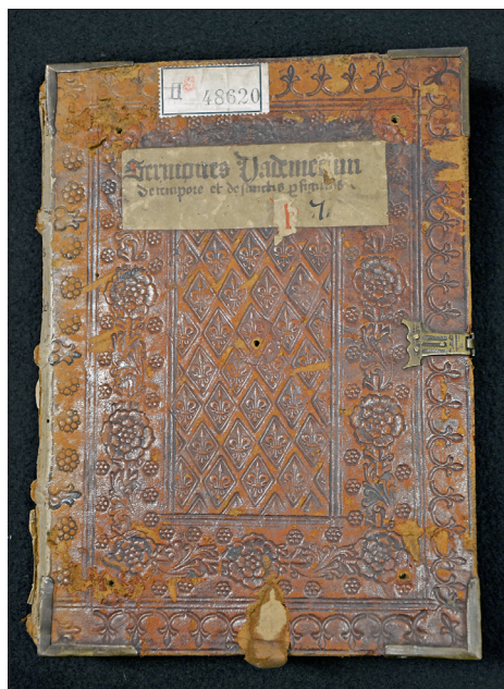
Obrázek č. 4: Příklad užití kolků skupiny Olmützer Kartäuserkloster (VKOL, sign. II 48.620).