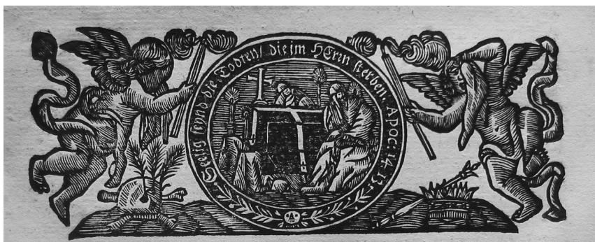
Obr. 2 Viněta na konci pohřebního kázání pátera Bonifacia nad Karlem z Liechtensteinu-Castelkorna (1695)