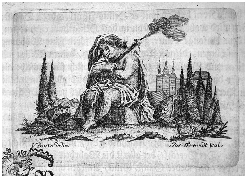
Obr. 5 Vlys z první strany pohřebního kázání Jana Leopolda von Hay nad Maxmiliánem Hamiltonem (1777)