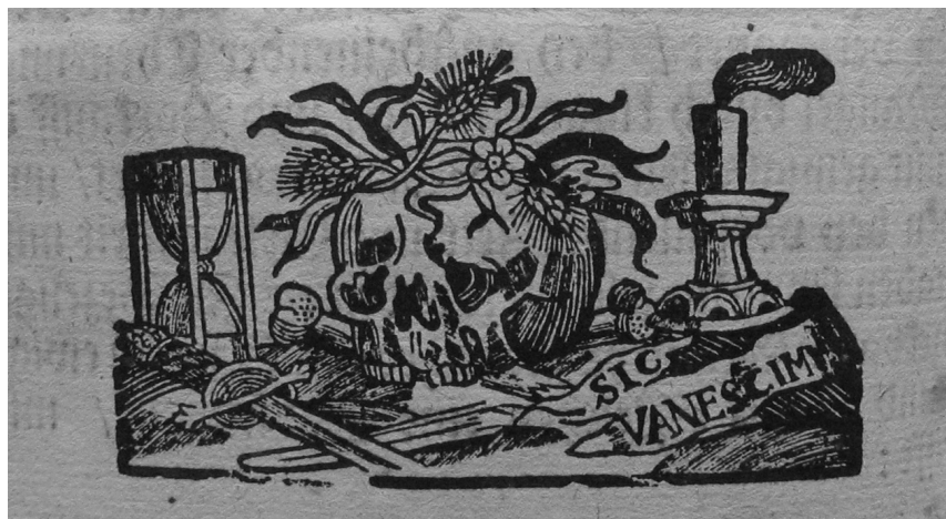
Obr. 6 Viněta ze závěru pohřebního kázání nad salcburským arcibiskupem Františkem Antonínem z Harrachu (1727)