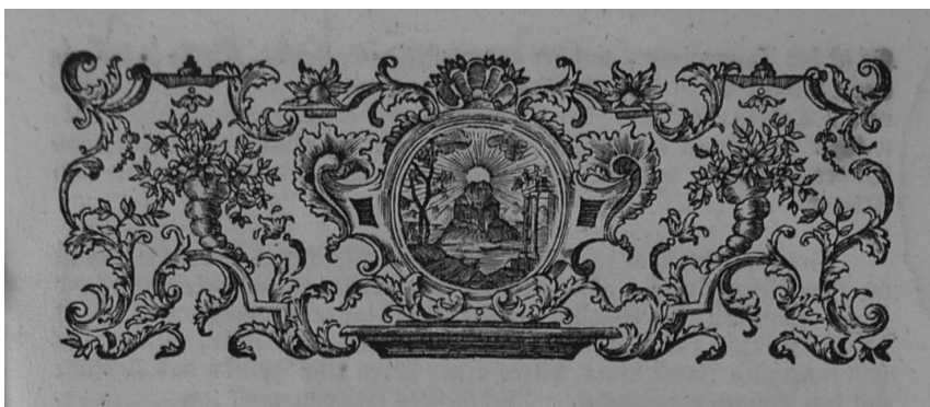
Obr. 4 Vlys z první strany pohřebního kázání Jana Michaela Neumanna nad Leopoldem Egkhem (1761)