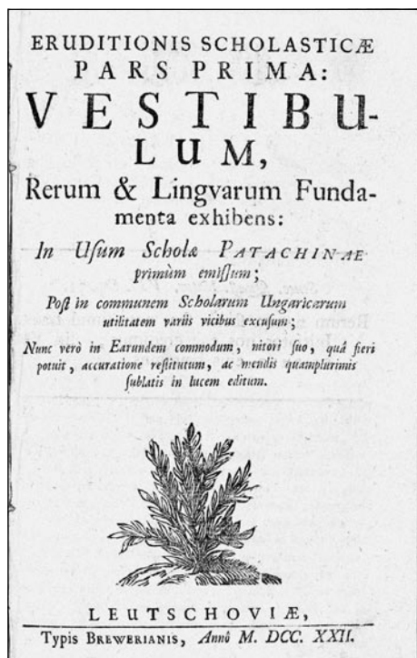
Obrázek č. 2: Eruditio scholastica z roku 1722 (sign. Ks-0036.107, přív. 2).

linky. Text tištěn latinsky a maďarsky. Citace: SDK 842; Vobr 274. Provenience: [razítko] Borbély Sándor könyvtárából. Původní polokožená vazba, hřbet z hnědé teletiny, desky potažené barevným papírem. Sign. Ks-0090.317