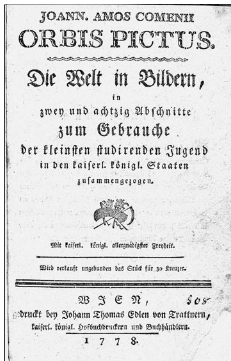
Obrázek č. 1: Orbis pictus z roku 1778 (sign. CH-0005.734).