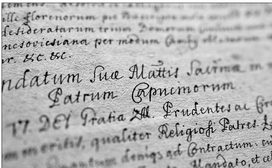
Obrázok č. 3: Ukážka z kroniky pezinských kapucínov.

Sedemnásť a osemnásť storočie boli charakteristické protitureckým odbojom a protihabsburskými povstaniami, ktoré ovplyvnili život celej krajiny. Rovnako ako v odbornej a tzv. krásnej literatúre, tak i v textoch pramennej povahy sa nachádzajú zmienky o udalostiach, ktoré bezprostredne súviseli s týmto dňom. V kronike sú podrobne zachytené udalosti spojené s bojami proti Turkom, ktoré neradostne zasiahli do kláštorného života: napr. bez stopy