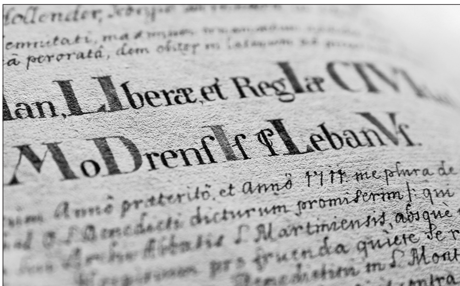
Obrázok č. 2: Ukážka z kroniky pezinských kapucínov.

kurfirstom Maximiliánom Emanuelom obliehalo a dobylo mesto Osijek a následne 9. decembra korunovali maloletého Jozefa za uhorského cisára.