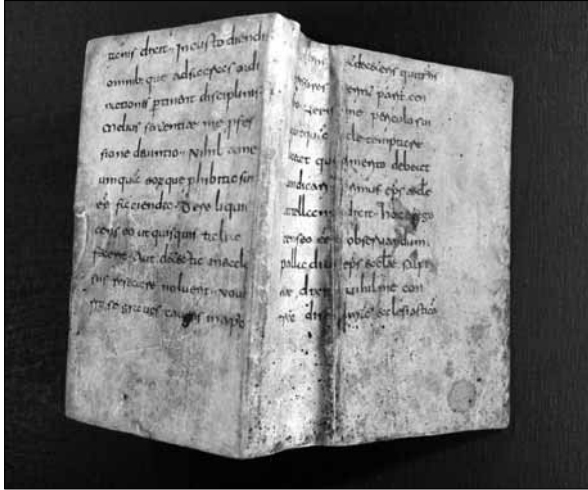
Obr. 1: Zlomek rukopisu kanonického práva na vazbě tisku vydaného v Norimberku roku 1710 (R, sig. P.I.cc. 27)