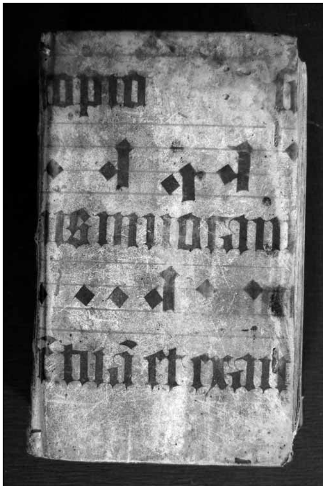
Obr. 6: Rukopis na vazbě knihy Cypriana Soara De Arte Rhetorica (R. sig. P. I. bb. 11)