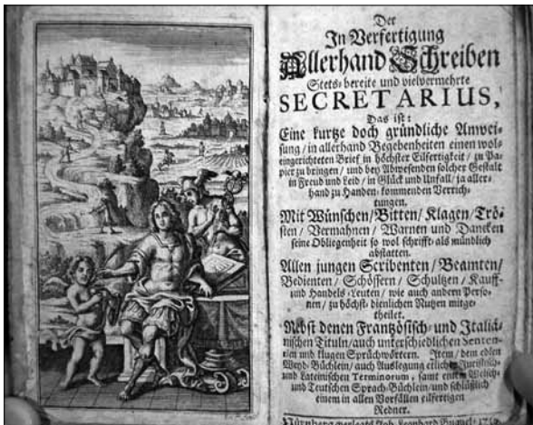
Obr. 2: Titulní list knihy Der in Verfertigung Allerhand Schreiben Stets-bereite und vielvermehrte Secretarius vydané v Norimberku roku 1710 (R, sig. P.I. cc. 27)