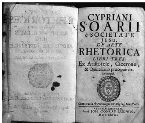
Obr. 5: Titulní list díla Cypriana Soara De Arte Rhetorica (R., sig. P.I.bb.11)