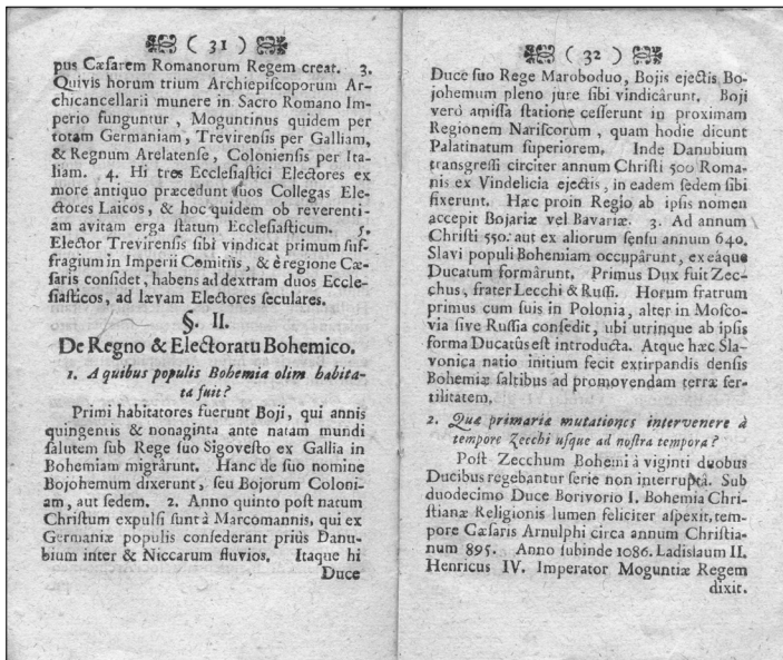
Ukázka ze IV. svazku učebnice Rudimenta historica..., s. 31–32