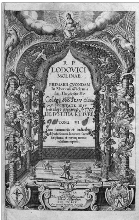
Obr. č. 2: Luis de Molina, De Justitia et jure , 1659, sv. 1. VKOL, sign. III 36.520/ 1.