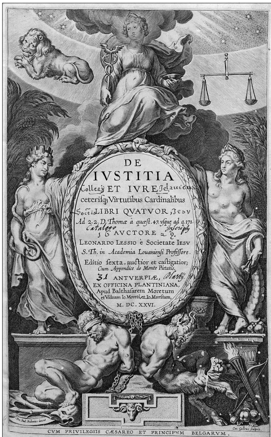
Obrázek č. 4: Leonardus Lessius, De Iustitia et Iure, 1626. VKOL, sign. III 36.518.