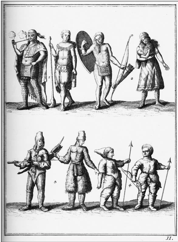
Obrázok č. 1: Ryt. II. (1. Huróni, alebo Irokézi, 2. Algonkíni, 3. Eskymáci, 4. Grónčania, alebo aj Nová Zem).

V prvej časti prináša Lafitau podrobný popis amerických krajín a národov, ktoré nájdeme aj na medirytinách – základným etnikom, z ktorého vychádzal a najlepšie poznal, sú muži a ženy Irokézov a Hurónov, 12 od tohto základu ukazoval rozdiely s Algonkinmi, Eskymákmi, obyvateľmi Grónska a ruskej Novej Zeme – ako prototypmi domorodcov zo severu. V porovnaníach predstavil južných Floridaňanov, Virgínčanov, Karibov z Antíl, domorodcov z Brazílie, Mexika a Peru, ale aj mýtických Acephalusov (bezhlaví ľudia, majúci tvár na hrudi), ktorých umiestnil do juhoamerických džunglí, [1].