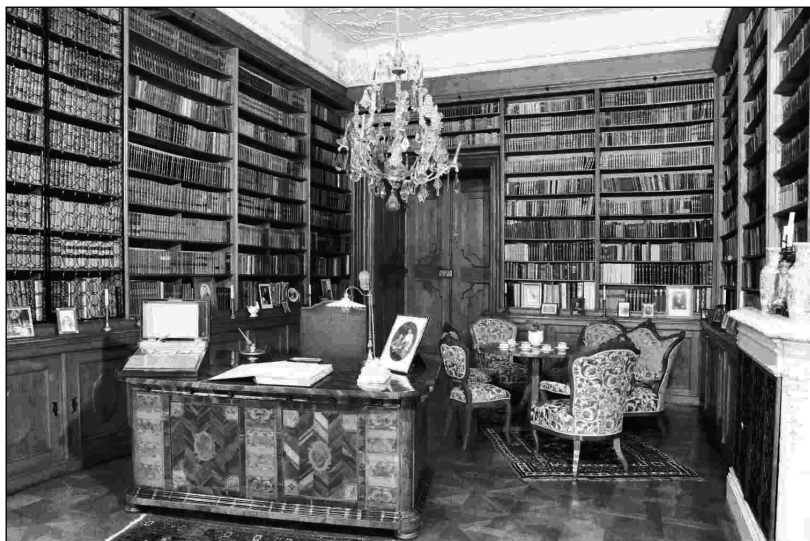
Obrázek č. 1: Velká knihovna v Miloticích