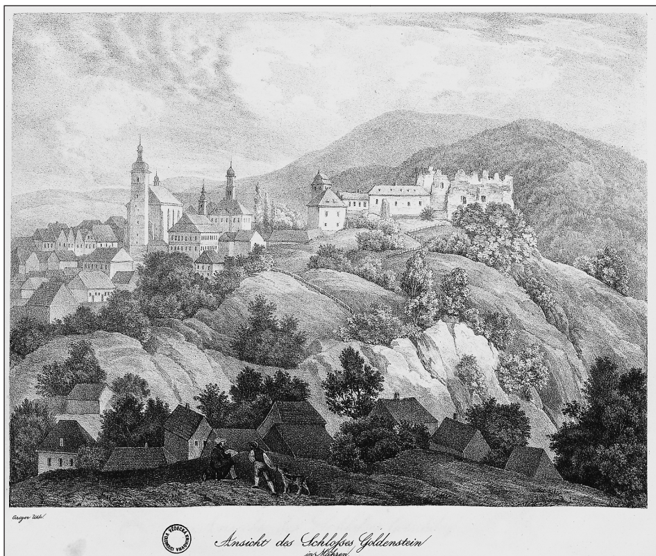
Obrázek č. 2: Litografie Branné z Kunikeho alba se sedící postavou kreslíře, VKOL sign. E II 170.701.