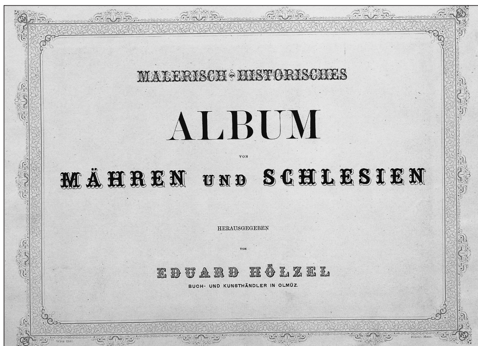
Obrázek č. 3: Titulní list Hölzelova alba, VKOL sign. E II 52.094/ 1, 2.