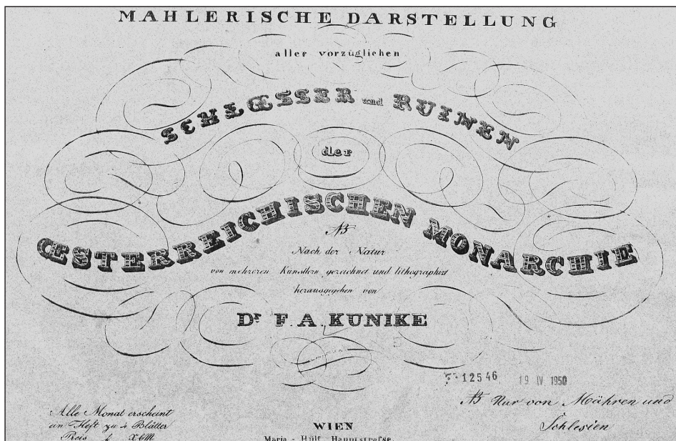
Obrázek č. 1: Titulní list Kunikeho alba, VKOL sign. E II 170.701.