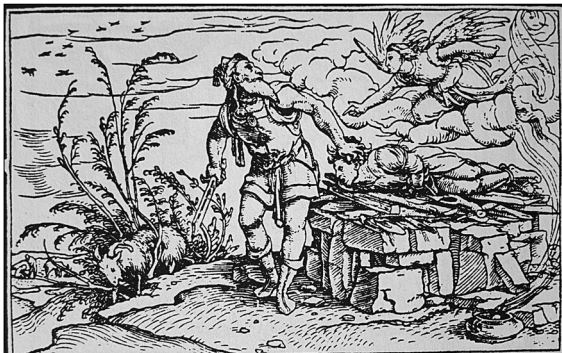
Srovnání Stimmerových biblických ilustrací s obdob- nými dřevorezy H. Holbeina ml. ( Abraham obětuje Izáka )