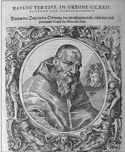
Portrét Pavla III v knize: Accurate Effigies Pontificum Maximorum, numero XXVIII: ab anno Christi 1378, Štrasburk 1573