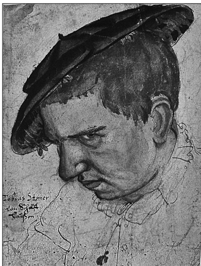
Vlastní autoportrét T. Stimmera z r. 1563