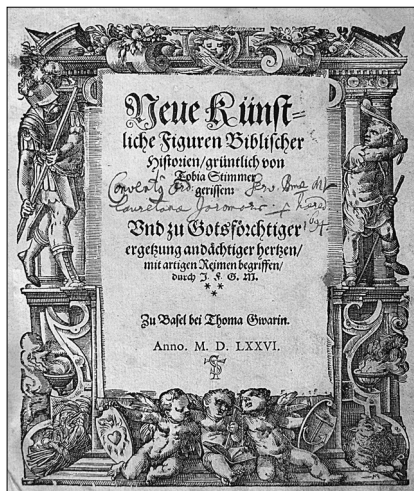
Titulní list knihy: Neue künstliche Figuren Biblischer Historien, Basilej 1576