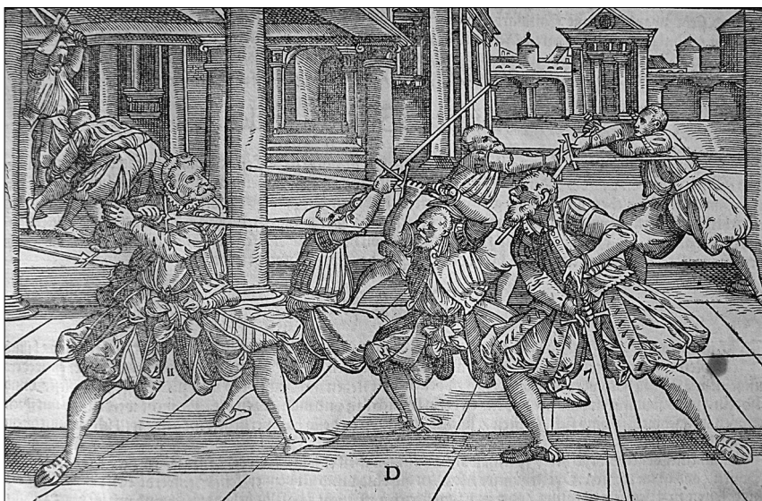
Dřevořez z knihy: Gründtliche Beschreibung, der freyen Ritterlichen vnnnd Adelichen Kunst des Fechtens, in allerley gebrauchlichen Wehren, mit vil schönen vnd nutzlichen Figuren gezieret vnd fürgestellt, Strasburk 1570