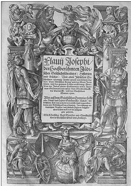
Titulní list knihy: Flauij Josephi, des Hochberühmten Jüdischen Geschichtschreibers, Historien vnd Bücher: Von alten Jüdischen Geschichten, zwentzig, sambt eynem von seinem Leben: Von Jüdischen Krieg... Štrasburk 1578