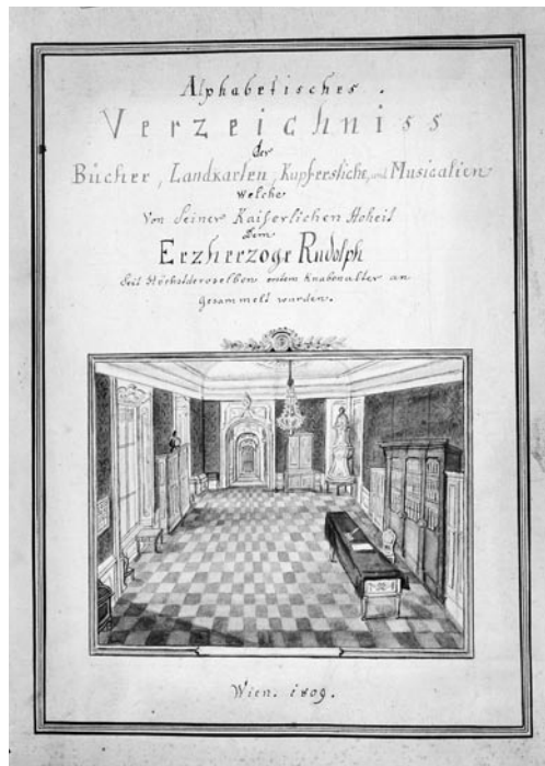
Obrázek č. 1: Arcidiecézní muzeum Kroměříž, titulní list inventáře Alphabetisches Verzeichniß der Bücher, Landkarten, Kupferstiche, und Musicalien Von seiner keiserlichen Hobeit dem Erzherzoge Rodolph gesammelt, sign. AMK 21609.