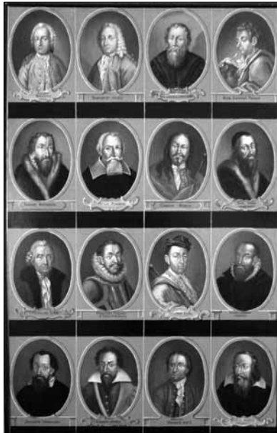
Obr. 2: Jeden ze zlatokorunských obrazů