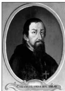
Obr. 4a: Zlatá Koruna