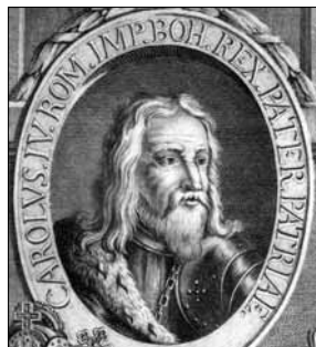
Obr. 3c: Abbildungen