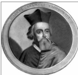
Obr. 4b: Tondo