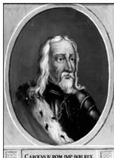
Obr. 3a: Zlatá Koruna