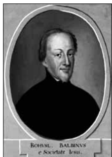
Obr. 5a: Zlatá Koruna