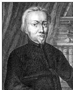
Obr. 5c: Abbildungen