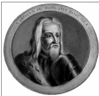
Obr. 3b: Tondo