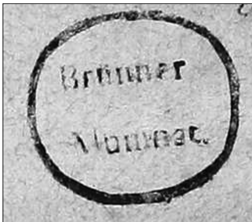
Obrázek č. 1: Razítko biskupského alumnátu

V roce 1750 byl patrně v brněnském františkánském klášteře sepsán kolektář – Florilegium selectissimarum... 52 Z druhé poloviny 18. století pochází torzo rukopisu knihy hodinek, obsahující litanie, antifony, modlitby a kolekty. 53 Z liturgických knih jsou v alumnátní knihovně zastoupeny evangelický kancionál a antifonář.