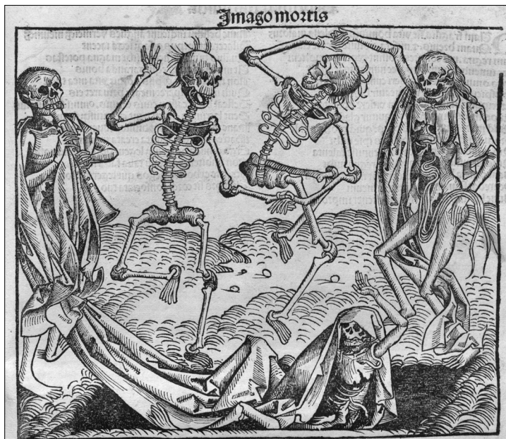
Schedel - Chronica librorum