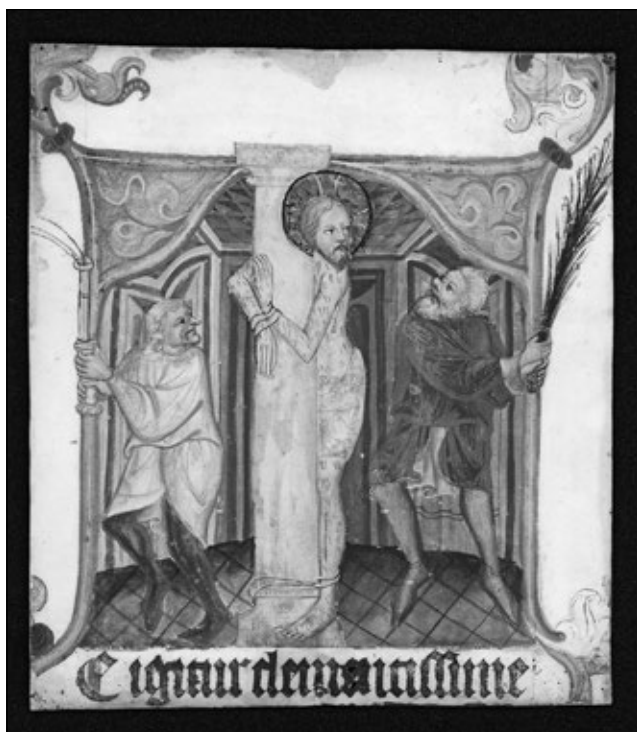
Obrázek č. 2: Vyřiznutá iniciála ze středověkého misálu se zobrazením výjevu bičování Krista. Sbírká grafiky oddělení starších českých dějin, Národní muzeum, inv. č. H2-6862/b.