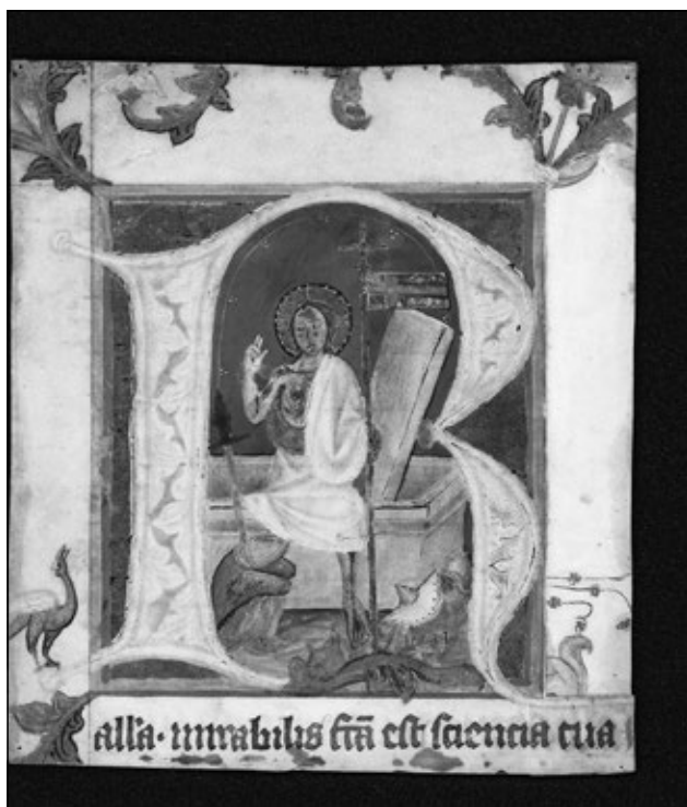
Obrázek č. 3: Vyřiznutá iniciála ze středověkého misálu se zobrazením Zmrtvýchvstání Krista. Sbírká grafiky oddělení starších českých dějin, Národní muzeum, inv. č. H2-6862/c.