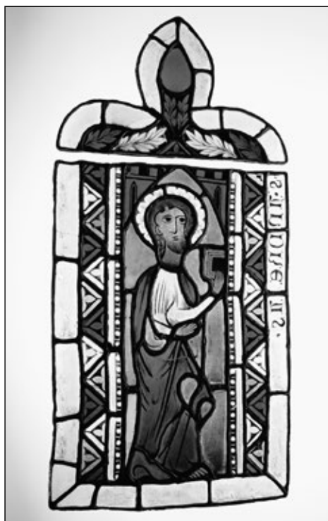
Obrázek č. 4: Vitráž z venkovského kostelíka v Žebnici u Plzně se zobrazením sv. Ondřeje. Sbírká grafiky oddělení starších českých dějin, Národní muzeum, inv. č. H2-7258.