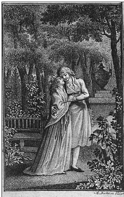
Obrázek č. 1 A01 Almanach und Taschenbuch...