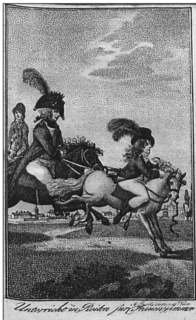
Obrázek č. 2 A01 Almanach und Taschenbuch...