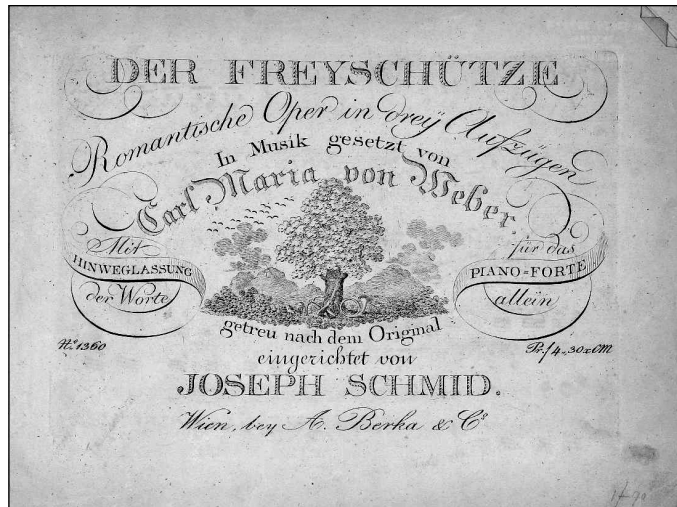
Obrázek č. 8

Hd2 Weber: Der Freyschütze