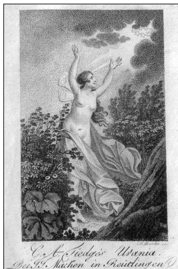
Obrázek č. 7