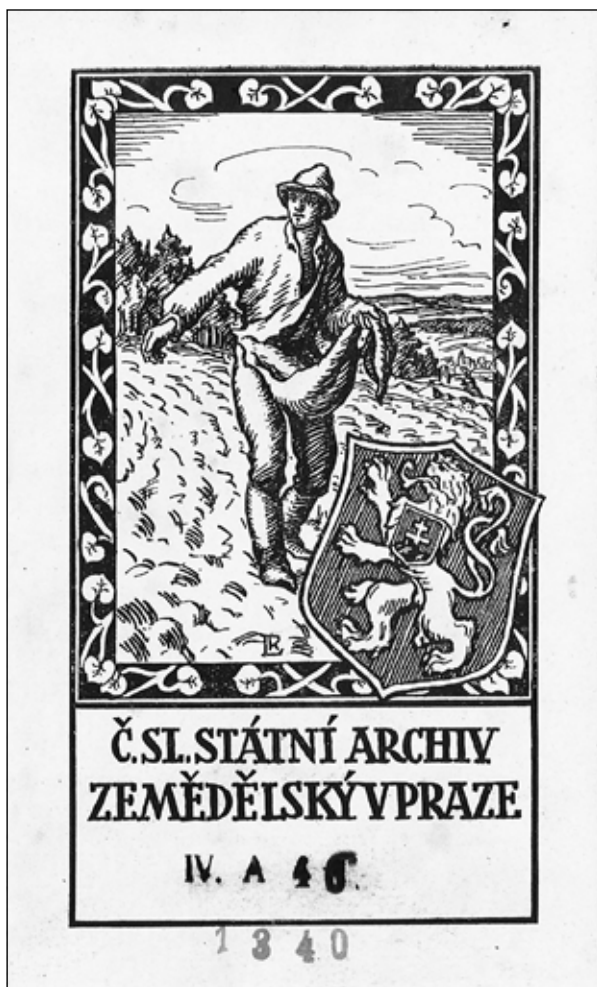
Obrázek č. 1: Exlibris Knihovny Československého státního archivu zemědělského používané v letech 1920–1939.

Vystudoval obory archivnictví a historie na Filozofické fakultě Univerzity Karlovy v Praze. Od roku 2014 pracuje v Knihovně Národního archivu, kde spravuje historické fondy a staré tisky. Zajímá se o písemnosti a správu středověkých klášterů, dějiny klášterních knihoven a zlomky středověkých rukopisů.