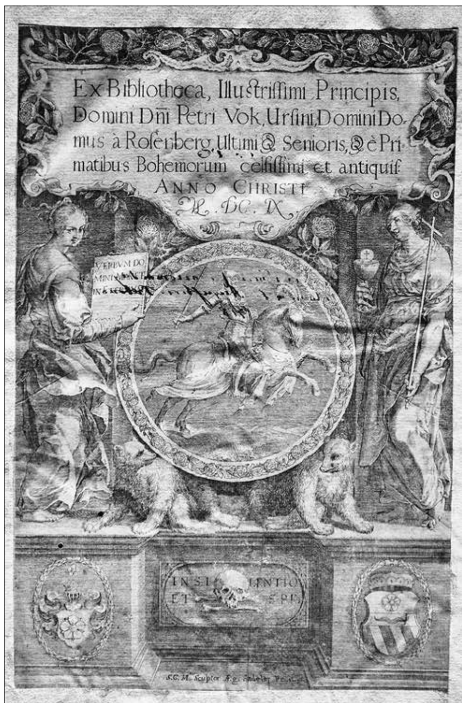
Obrázek č. 3: Exlibris Petra Voka z Rožmberka z roku 1609 – KNA, fond Knih.C, sign. IV A 46, přední předšádka verso.