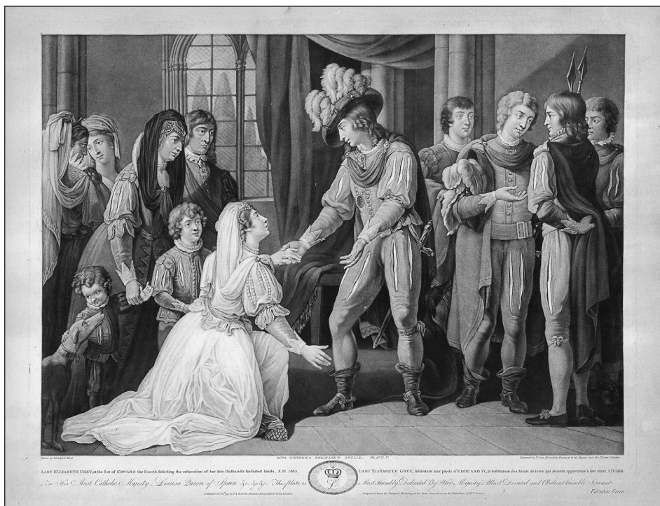
Obrázek č. 4: Green, V. Lady Elizabeth Grey... London, 1791. (R-GR-138,47,5).