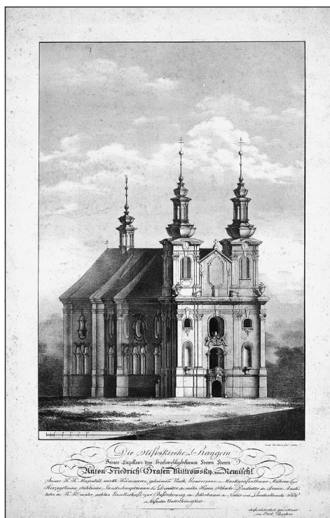
Obrázek č. 7: Bschor, C. Die Stiftskirche in Raygern... Brno, 1824. (R-GR-138,59).