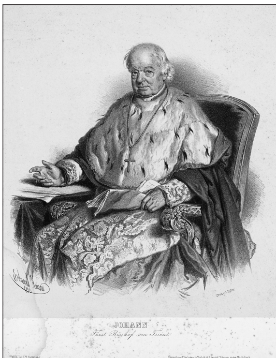
Obrázek č. 8: Kaiser, E. Johann Fürst Bischof von Orient... Wien, 1856. (R-GR-36).