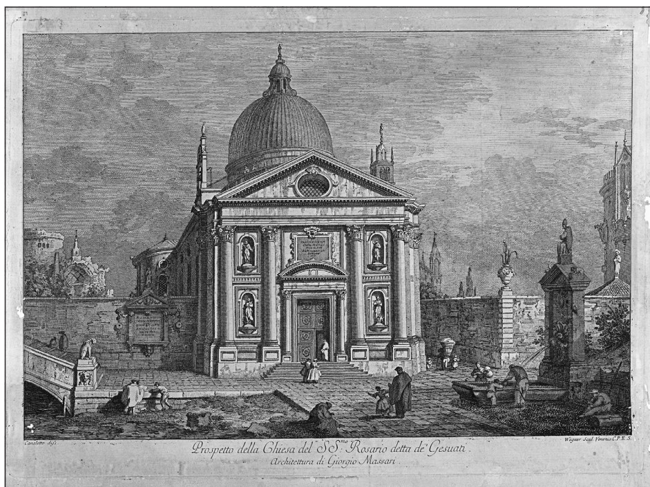
Obrázek č. 3: Canaletto. Prospetto della Chiesa del S.S. mo Rosario detta de' Gesuati Architettura di Giorgio Massari. Venezia, 1742. (R-GR-11,4).