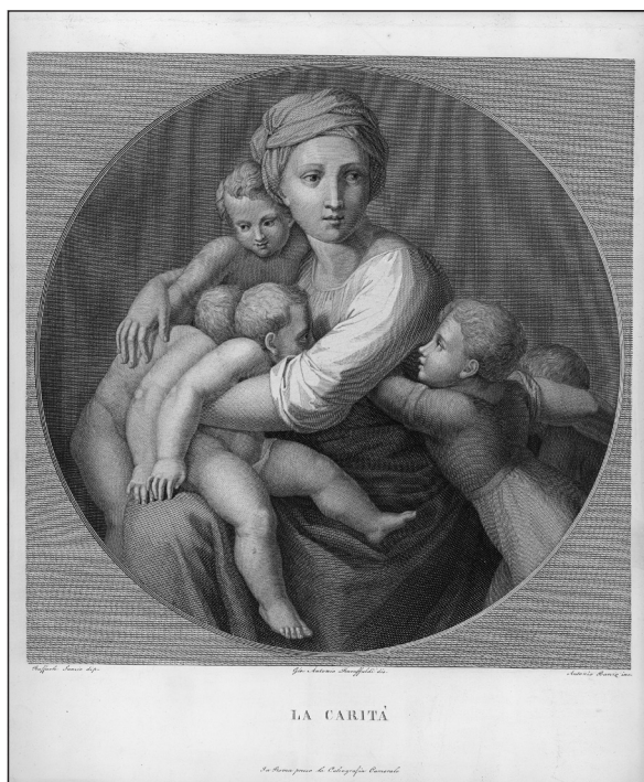
Obrázek č. 2: Baruffaldi, G. A. La Carita Rafaele Sanzio... Roma, 1820. (R-GR-137,21).