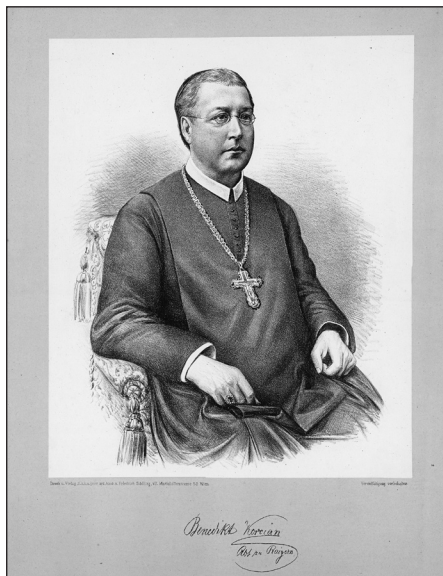
Obrázek č. 6: Schilling, F. Benedikt Kocian Abt zu Raigern... Wien, 1883–1900. (R-GR-14).