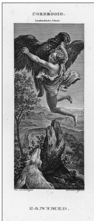
Obrázek č. 5: Perger, S. F. Correggio. Lombardische Schule. Ganymed... Vienne et Prague, 1821–1828. (R-GR-10,166).