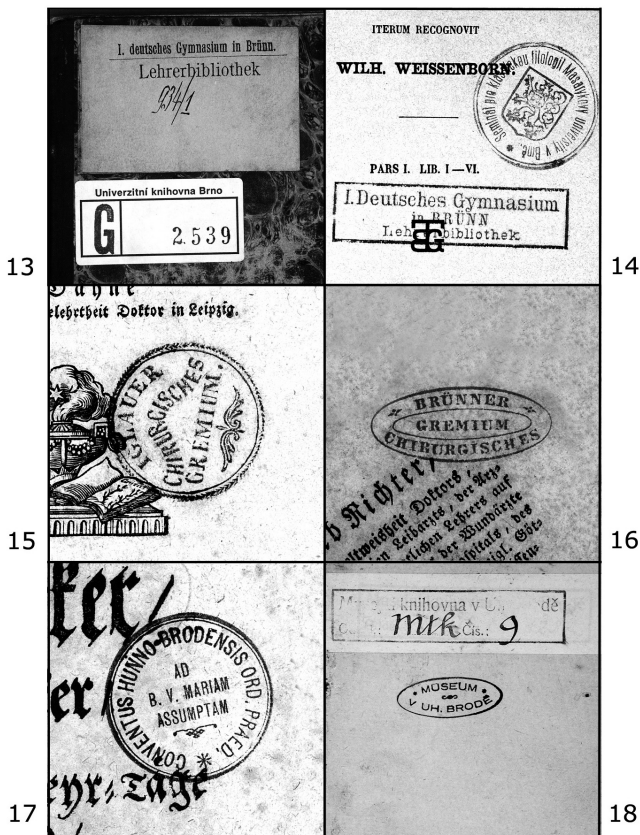
13–14: Knihovna I. německého gymnázia v Brně; 15–16: Knihovna jihlavského chirurgického grémia; 17–18: Muzejní knihovna z Uherského Brodu