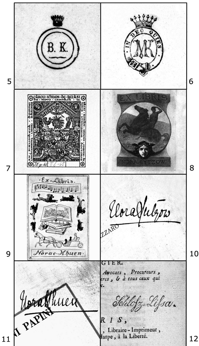
5-6: Zámecká knihovna Kübecků von Kūbau z Lechovic; 7-11: Zámecká knihovna hrabat Khuen-Belasi z Emina Dvora u Hrušovan nad Jevišovkou; 12: Zámecká knihovna z Lysé nad Labem