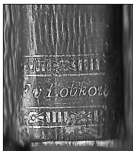
Obrázek č. 3: Ražba na hřbetě adresáře Drážďan z roku 1806.