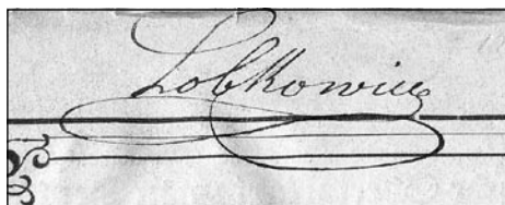
Obrázek č. 2b: Vlastnický přípisek „Lobkowicz“.