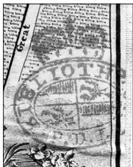
Obrázek č. 2a: Vlastnické razítko Lobkowiczů.

Na jednotlivých exemplářích ojediněle nacházíme razítko s lobkowiczským znakem (143; 62 A 310 a 29; 62 A 269) [2a], podpisy Lobkowicz (62 A 205, 62 A 277, 62 A 337) [2b], případně Bertha Lobkowicz (Anna Berta princezna ze Schwarzenbergu, 1807–1883) (62 A 659–749) [2c].