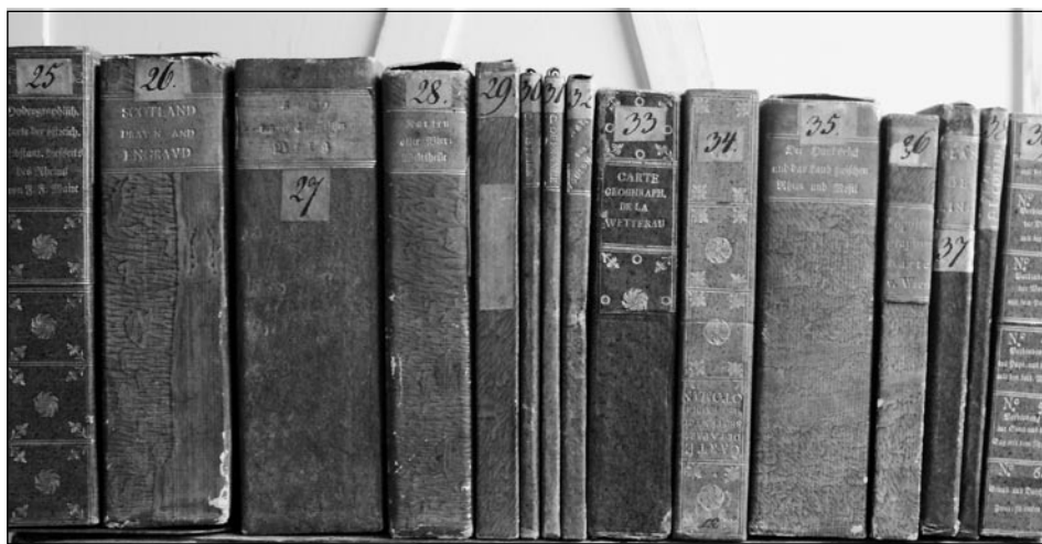
Obrázek č. 1: Staré signatury Lobkowiczské mapové sbírky, patrně z první třetiny 18. století.

provenienční znaky, ale současně i na doklady méně zřetelné, například na možné vazby mezi činnostmi či zájmy konkrétních příslušníků hořínsko-mělnické větve a jednotlivými exempláři sbírky, zejména rukopisnými.