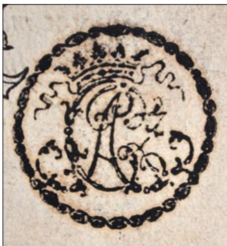
Obrázek č. 2: Vlastnické razítko Vojtěcha Czernina.