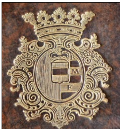
Obrázek č. 1: Zlacené heraldické czerninské supralibros.