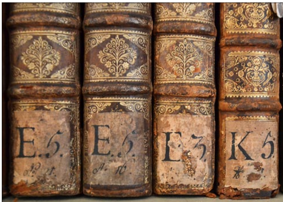
Obrázek č. 3: Signaturový štítek czerninské rodové knihovny.