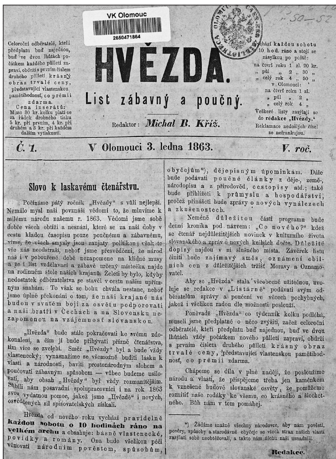
Obrázek č. 1: Titulní list Hvězdy .

myšlenek etnické jednoty slovanských obyvatel Čech, Moravy (částčně i Slezska a Horních Uher), jednoty zemí Koruny české, jazykové jednoty, uznání historického práva a liberální požadavky. Nešlo primárně o politické periodikum, ale o časopis, jenž zprostředkovával beletristické texty, etnografické zprávy, cestopisné črty, poezii, překlady, úryvky z historických románů, povídky apod. a na základě těchto literárních útvarů zároveň propagoval český (českoslovanský) národní program, jenž na Moravě stál vedle dalších tendencí, k nimž náležel zemský princip, etnický moravismus a moravskoslovanská tendence. 1