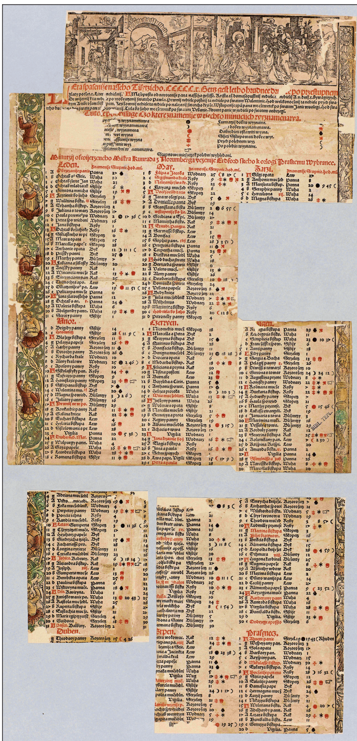
Obrázek č. 2: Rekonstruovaná podoba minuce na rok 1510 (NK ČR, sign. Teplá fragm. 505).