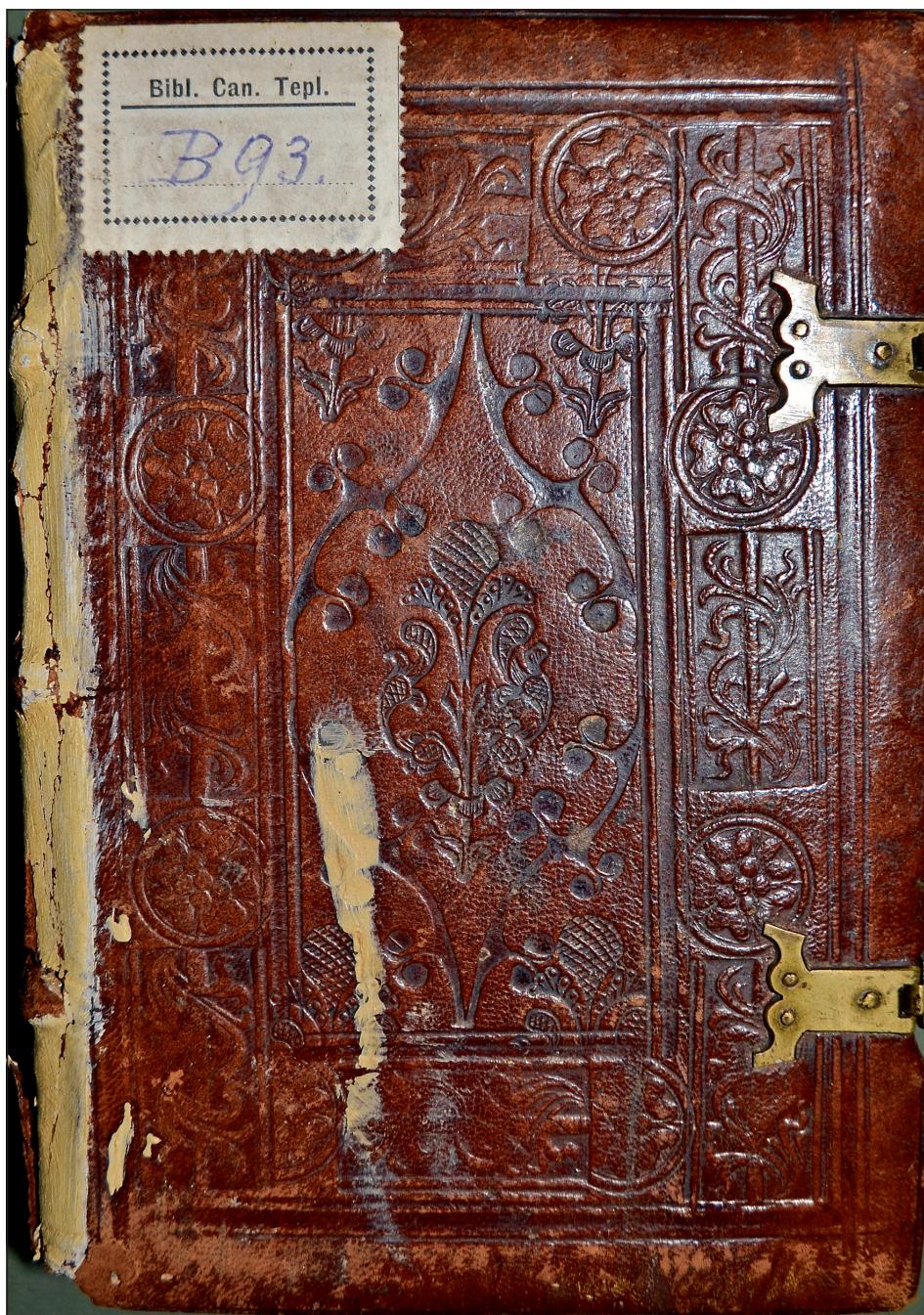
Obrázek č. 1: Ukázka typické výzdoby tepelské vazby (NK ČR, sign. Teplá B 93).