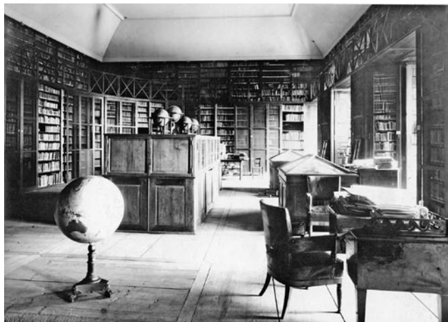
Obrázek č. 1: Thunovská knihovna na děčínském zámku v roce 1903.