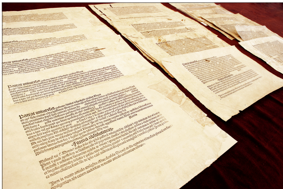
Obrázek č. 4: Série totožných formulářů odpustkových listů asi z roku 1482, sejmutá z chebských vazeb (NK ČR, sign. Cheb 3/54, Cheb fragm. 109–127, fragm. 148–149).