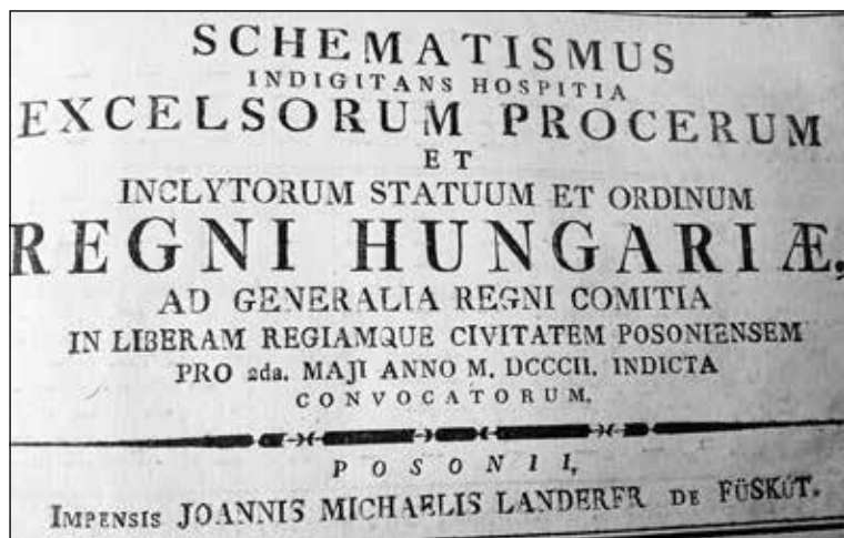
Obrázok č. 3: Titulný list schematizmu – adresára účastníkov snemu v roku 1802