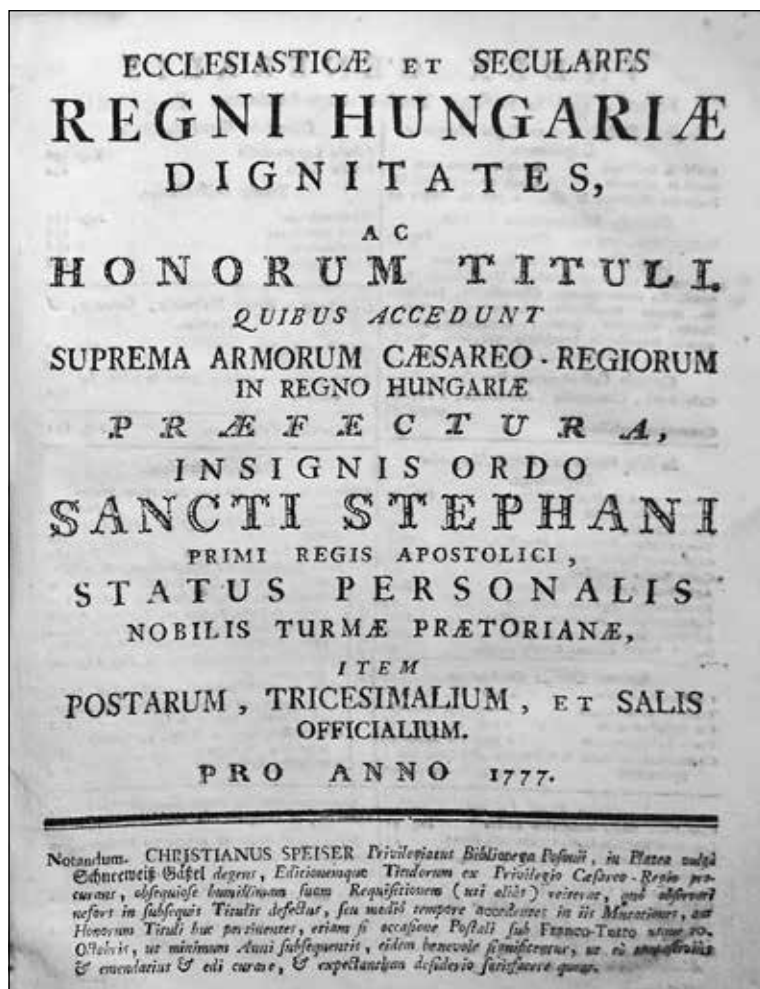
Obrázok č. 2: Titulný list schematizmu z roku 1777